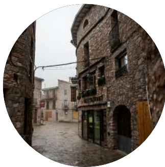
Castellar de n'Hug