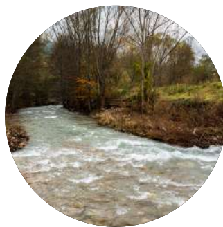
El riu Llobregat