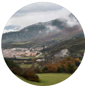
La Poble de Lillet