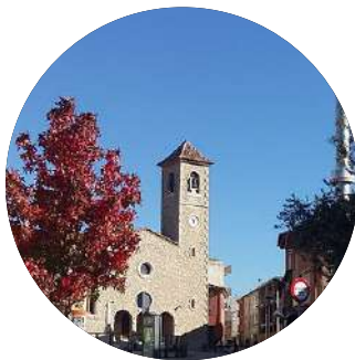
Els Hostalets de Balenyà