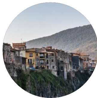
Castellfolit de la Roca