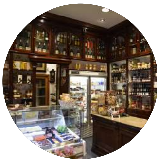
Comerç de Vic